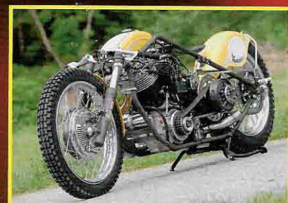
ANDREOLI MOTORCYCLES - Project 22