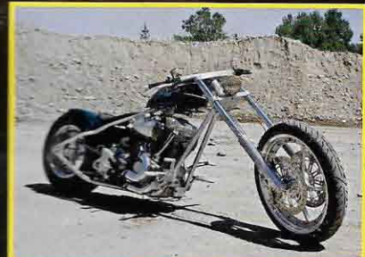
CRAZY CHOPPERS - Revenge