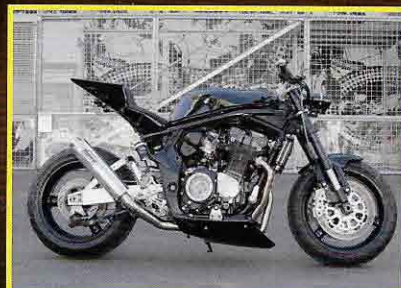
SUZUKI BANDIT - Streetfighter